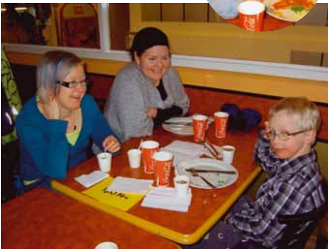
Päijät-Hämäläiset nauttivat Raxin antimista.

Kireitä helmikuun pakkasia on riittänyt täälläkin suunnalla, eikä lumesta todellakaan ole ollut pulaa! On ollut mahtavaa saada nauttia talven riemuista hiihdellen, luistellen ja lasketellen, kuka pulkalla kuka suksilla. Meillä kun on siihen erinomaiset edellytykset täällä Salpausselän maisemissa! Ystävänäpäivää emme kuitenkaan juhlistaneet sen paremmin ladulla kuin jäälläkään, vaan paikallisessa pizzeriassa notkuvien herkkupöytien antimista nauttien ja iloisesti toistemme kanssa keskustellen vertaistuen merkeissä. Puheensorina olikin melkoinen, sillä paikalla oli runsaasti päijät-Hämäläisiä sydänlapsia ja -nuoria perheineen ja tukijoukkoineen. Hiljaiseksi ei siis ainakaan tätä hämäläistä joukkoa voinut luonnehtia!