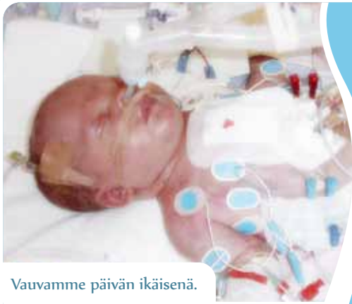
Vauvamme päivän ikäisenä.