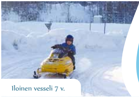
Iloinen vesseli 7 v.

Onko perheille ollut hyötyä Sydänlapsi -toiminnasta ja kuulumisesta siihen?